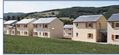
Франция - South / Center - Saint Geniez d'Olt / Aveyron - Поселок Goellia III

Инвестиции В Камень • Система Leaseback • Гарантированный доход от сдачи в аренду до 4,6 % • Сдача - июль 2005 • Возможно проживание владельца • 1-спальные квартиры от 44 до 45 м 2 – от 135 000 до 188 000 € • 2-спальные квартиры от 54 до 55 м 2 – от 198 000 до 250 000 € • С видом на Архипелаг Seven Islands и пляж.