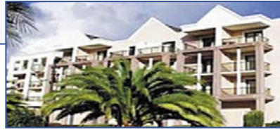
Франция - Brittany - Cotes d'Granit Rose/Perros Guirec - Резиденция Archipel

Жемчужина Исторической Архитектуры • Система Leaseback / 9-летний контракт • Проект на реконструкции • Кварты-Studio от 26 до 32 м 2 – от 107 000 до 128 000 € • 1-спальные квартиры от 34 до 69 м 2 – от 118 000 до 231 000 € • Гарантированный доход от сдачи в аренду до 5 % • Не требуется tax-предоплата • Сдача - ноябрь 2005 • Возможно проживание владельца • Расположение – на пляже, в 400 м от станции скоростного поезда на Париж.