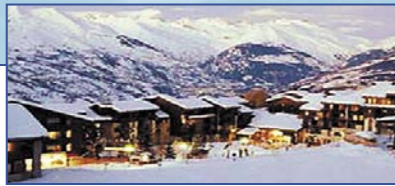
Французские Альпы - Savoie / Les Coches - Резиденция La Marelle

Виды На Огни Парижа • На берегу Сены, слева от Trocadero и справа от Эйфелевой Башни • Четыре вида апартаментов-studio (от 138 962 до 254 127 € - от 23,03 м 2 до 28,6 м 2 ) • Восемь 1-спальных апартаментов (от 298,246 до 433,112 € - от 40,16 до 46,47 м 2 ) • Почувствуйте себя как дома в гостеприимном Париже.