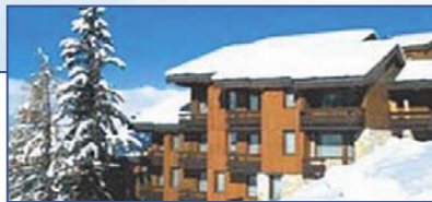
Французские Альпы / Ain - Belle Plagne 1800 - Резиденция Plagne Lauze

Живописное Размещение Вдоль Реки Lot • Система Leaseback / Контракт - 11 лет • Гарантированный доход от сдачи в аренду до 5 % • Сдача - июль 2005 • Возможно проживание владельца • 1-спальные квартиры от 39 до 48 м 2 – от 58 000 до 67 000 € • 1-спальные квартиры от 38 до 40 м 2 – от 77 000 до 82 000 € • 3-спальные квартиры от 44 м 2 – от 89 000 до 90 000 € • Расположение – Центральные Пиренеи, у реки Lot, 3 е , 2 бассейна, ресепшен.