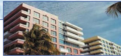
США - Florida / Miami - The Bentley Beach

Природное Наследие La Vendée • 6 Studio-квартир для размещения 3/4 человек - от 30 до 32,4 м 2 - 92 000 € • 85 1-спальных квартир для 3/4 и 4/5 человек - от 26,2 до 34,3 м 2 - 99 000 € • 29 2-спальных квартир для 5/6 и 6/7 человек - от 35,4 до 42,6 м 2 - 136 500 € • Гарантированный доход от сдачи в аренду до 4,5 % • Планы по размещению на 0, 3, 6 недель • Заезд - декабрь 2005 • Прекрасное природное наследие La Vendee, между Green Venice и островом Yeu La.