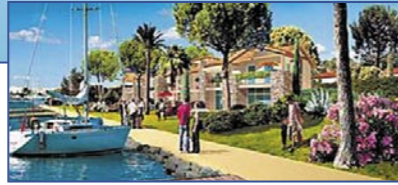
Франция – Французская Ривьера / Cap d'Agde - L'île Saint Martin

Единение С Морем • Размещение - от 4 до 8 человек, от 24,2 м 2 до 42,45 м 2 • От 157 910 до 291 785 € с гарантированным доходом от сдачи в аренду до 4,9 % • Меблированные светлые апартаменты с оборудованными кухнями, парковка • Ванные, балконы, террасы, частные сады, виды на море или сад • Расположение – рядом с Saint Tropez.