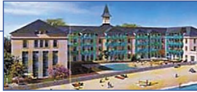
Франция - Brittany - Le Croisic - Резиденция Saint Goustan

Жемчужина Исторической Архитектуры • Система Leaseback / 9-летний контракт • Проект на реконструкции • Кварты-Studio от 26 до 32 м 2 – от 107 000 до 128 000 € • 1-спальные квартиры от 34 до 69 м 2 – от 118 000 до 231 000 € • Гарантированный доход от сдачи в аренду до 5 % • Не требуется tax-предоплата • Сдача - ноябрь 2005 • Возможно проживание владельца • Расположение – на пляже, в 400 м от станции скоростного поезда на Париж.