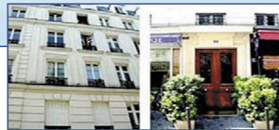
Франция - Ile de France / Paris - 16th District - Резиденция Annunciation

Великолепные Инвестиции В Пиренеи • Система Leaseback / Контракт - 12 лет • Studio-апартаменты от 30 до 36 м 2 – от 110 000 до 128 000 € • 1-спальные апартаменты от 45 до 58 м 2 – от 165 000 до 218 000 € • 1-спальные Cabine-апартаменты от 58 м 2 – от 186 000 до 218 000 € • Гарантированный доход от сдачи в аренду до 6,45 % • Возможно проживание владельца • Сдача - октябрь 2005 • Расположение - центр Ariège, рядом Guzet – горнолыжный курорт на высоте 1400 м. В окружении леса.