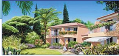
Французское средиземноморское побережье - Cap Negre - La Pinede

Престижное Размещение В Высококлассном Районе Sixteenth • Классический 4-этажный дом • 1-спальные апартаменты • 28,4 м 2 - 180 000 € • Полностью меблированы и оборудованы • Паркет, камин, пароб, вид на пешеходную зону • Ожидаемый доход от сдачи в аренду - 5 % • Заселение сразу после покупки • Знаменитое место, где долгие годы жил Бенджамин Франклин.