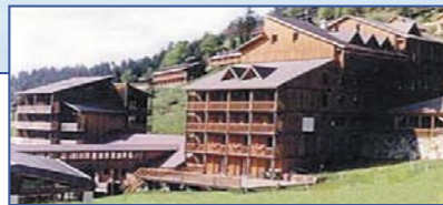
Франция - South / Center - Pyrenees / Guzet - Резиденция du Haut Couserans

Plagne 1800 – Идеальная Высота • Система Leaseback / Проект на реконструкции • Возможно проживание владельца • Гарантированный доход от сдачи в аренду до 4,5 % • Сдача - январь 2005 • Кварты-studio от 24 – 32 м 2 – от 106 000 до 138 000 € • 1-спальные квартиры от 29 до 49 м 2 – от 128 000 до 207 000 € • 2-спальные квартиры от 66 м 2 – 319 000 € • На вершине Французских Альп Savoie, Mont Blanc, на всемирно известном горнолыжном курорте La Plagne.