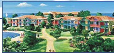
Франция / Atlantic Coast - Chateau D'olonne - Резиденция De L'Estran

В Savoie, Сердце Tarentaise • Апартаменты-studio для размещения 3/4 человек – от 22,7 до 27,5 м 2 – 77 000 € • 1-спальные апартаменты для 3/4 или 4/5 человек – от 27,2 до 36,6 м 2 - 108 000 € • 2-спальные апартаменты для 6/7 человек – от 37 до 49,6 м 2 - 169 000 € • Гарантированный доход от сдачи в аренду до 4,5 % • С видом на Mont Blanc и Beaufortin. Горнолыжный курорт.