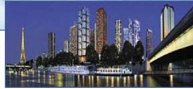
Париж - 15ème Arrondissement - Paris Cote Seine

Роскошные Виллы На Частном Острове С Пристанью • 3-спальные виллы – от 129 м 2 до 177 м 2 жилой площади + террасы, сады и частное джакузи – от 561 000 до 635 000 € + террасы, сады и частный бассейн - от 1 010 000 до 1 055 000 € • Полностью меблированные дома с частными гаражами и местом на пристани • Гарантированный доход от сдачи в аренду до 4 % + полное возмещение налогов до 19,6 % • Заезд - декабрь 2005 • Получите удовольствие от нового "Arte de Vivre" на частном острове с пристанью.