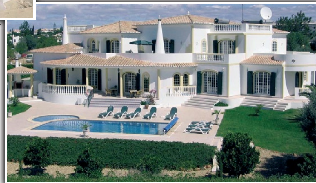
Вилла в Карвоейро / Сесмариас с площадью застройки в 900 м² – 1 795 000 Евро

Мы будем Вашим гидом и консультантом в процессе покупки Наш девиз – покупатель всегда прав