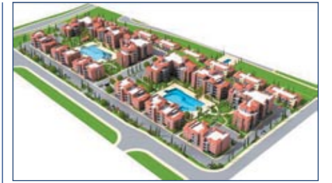
Комплекс Elysia Park

Московское представительство расположено по адресу: 123610, Москва, Краснопресненская набережная, дом 12, Центр международной торговли, подъезд 6, офис 1032. Телефон (495) 258-19-70/71. Сайт в Интернете: www.pafilia.ru