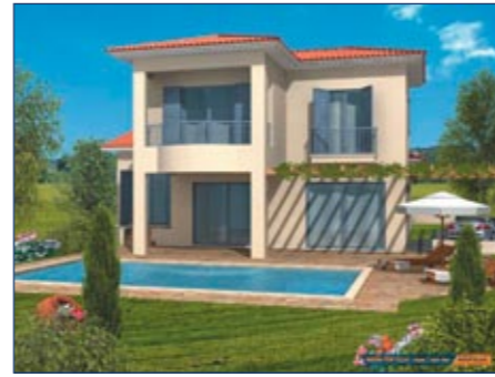
Вилла в комплексе Latsi Marina View

Комплекс Latsi Marina View расположен в одном из самых прекрасных уголков западного Кипра — на берегу залива Хрисохи. Российские туристы знают это место под названием Лачи, именно здесь, по преданию, располагались знаменитые купальни Афродиты. Рядом находится национальный заповедник Акамас, в котором растут реликтовые эвкалипты. Пляжи из золотого песка обрамляются многочисленными зарослями кустарников и деревьев, уходящими в горы. Это самая зеленая территория на Кипре.