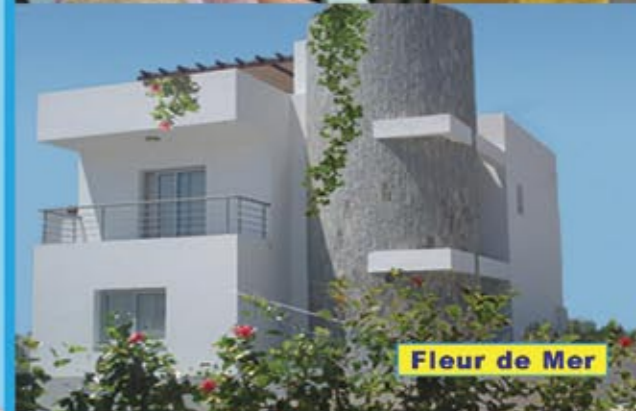
Fleur de Mer