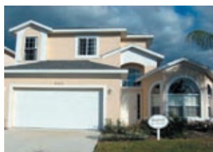
Crystal Cove Resort Цена: 467 000 $

Великолепно спроектированные виллы Juno Beach, несмотря на одноэтажное расположение, предлагают своим владельцам просторные жилые площади 156 м 2 , высокие потолки, множество больших окон, визуально увеличивающих внутреннее пространство дома. Большая гостиная, отдельная кухня, 4 спальни, две из которых с собственными ванными комнатами, оригинальные арочные входные двери, закрытый гараж. Сделайте свой выбор и насладитесь жизнью в комплексе Juno Beach!