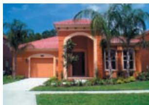
Bellavida Beach Sands Resort, Juno Beach Цена: от 370 000 $

Encantada — очаровательное местечко, восхищающее красотой природы и разнообразием фауны. Bellavida Beach Sands Resort расположен приблизительно в 2 милях от Диснейленда. Идеальный выбор для выгодных инвестиций или приобретения второго дома. Инфраструктура комплекса предлагает широкий спектр услуг по обслуживанию вилл, услуги консьержа, а также выбор магазинов продуктов питания и сувенирные лавки. В последнее время наблюдалось снижение цен более чем на 60%. Поэтому сейчас лучшее время для приобретения собственного дома во Флориде по очень низким ценам!