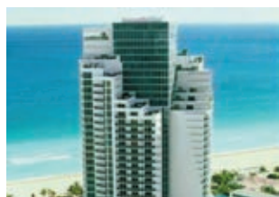
Sunny Isles Beach Цена: 555 000 $

Элитные апартаменты (208 м 2 ), расположенные в частной резиденции, непосредственно на береговой линии. Две просторные спальни, 2 санузла с мраморными ваннами и джакузи, великолепная кухня с мебелью цвета вишневого дерева и бытовой техникой, многофункциональный холодильник с отделением для охлаждения вина. Высокие потолки. Океанский пляж с двумя ресторанами, элитным спа с разнообразным спектром услуг и фитнес-центром. 2 открытых подогреваемых бассейна на пляже.