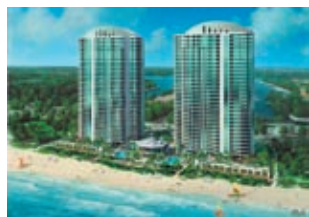
Sunny Isles Beach Цена: 1 695 000 $

Райские апартаменты с тремя спальнями (227м 2 ) и потрясающим видом на океан. Полы из белого мрамора являются продолжением небесной голубизны океана. С террас, окружающих апартаменты, вы можете любоваться великолепными пляжами, восходом и закатом, проплывающими кораблями и огнями ночного города. Неподалеку расположены элитный фитнес-центр, студия аэробики, спа-центр и спортивные площадки. Год строительства — 1993.