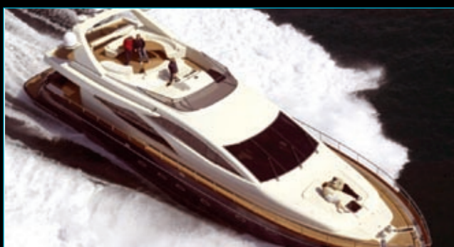
Riva Opera 85 / 2005