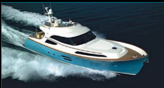
Mochi Dolphin 74 / 2005