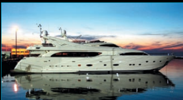
Custom Line 112 / 2003