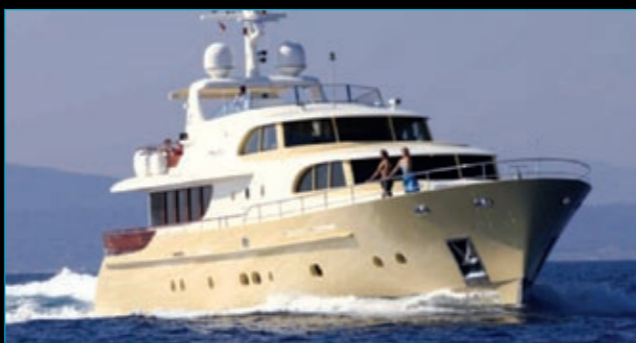
Cyrus Yachts 33 My Fansea / 2007