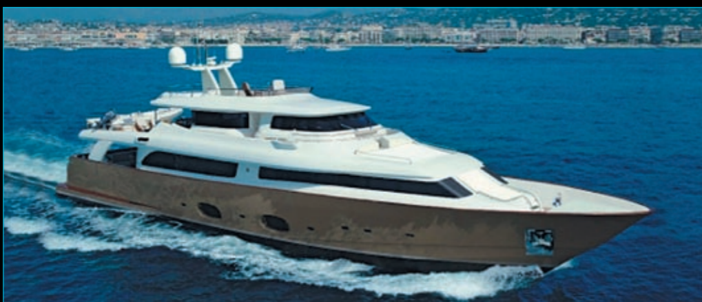
Custom Line Navetta 33 M