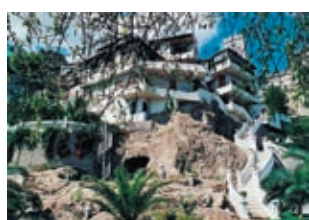
Вилла Savoca Цена: 1000000 €

Комплекс Calabria (Santa-Venere) расположен в самом сердце Вибо Марини, на Турханском побережье, недалеко от аэропорта, коммерческого центра и рядом с городками Tropea и Parghelia. Безупречные пляжи с мелким песком, окруженные крутыми утесами и небольшими бухтами. Огромный выбор развлечений; многочисленные бары, траптории и кафе. Calabria предлагает большой выбор ресторанов, магазинов и бутиков. Поблизости находится пристань для частных яхт. Комплекс, выполненный в классическом итальянском стиле, находится в зеленой зоне и объединяет 120 роскошных апартаментов площадью 70-100 м². Апартаменты с 2 спальнями: 123841-146591 €.