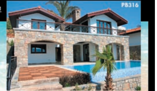
Роскошная Вилла, расположенная на побережье

Тел.: 0090 242 8441345 Факс: 0090 242 8442789 Email: info@property-turkey.ru