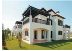
Комплекс «Королевские гольф-виллы» Цена: 300000 €

Комплекс «Королевские гольф-виллы» расположен в регионе Белек, около гольф-клуба National Golf Club, в 1 км от моря. Расстояние до аэропорта Анталя — 35 км. 4-комнатные 2-уровневые дуплекс гольф-виллы (205 м²) расположены в круглосуточно охраняемом частном комплексе. Гостиная с кухней (студия), 3 спальни (1 с ванной комнатой, джакузи), 2 ванные комнаты (одна с душевой кабиной), туалет, 4 балкона. Встроенная кухонная мебель и бытовая техника, сантехника, керамические и каменные полы, 2 кондиционера, водонагрев. Инфраструктура комплекса: открытый бассейн — 500 м², детский бассейн — 70 м², детская площадка, спа-центр, фитнес-центр, теннисный корт, магазины.