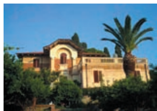
Вилла, Orto Liuzzo Цена: 2200000 €

Orto Liuzzo, Виллафранка, Палермо. Вилла площадью 3229 м². Общая площадь земельного участка — 344445 м². Бассейн и теннисный корт, великолепный просторный сад, автостоянка на 10 машин. В ясный день из окон вашей будущей виллы открывается сказочный вид на острова Aeolian. О чем еще можно мечтать?!