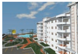
Комплекс Calabria (Santa-Venere) Цена: от 123841 €

Salina, Aeolian Islands, Сицилия. Вилла площадью 2476 м² с великолепной просторной террасой (1453 м²) и садом (538 м²). Бассейн, автостоянка на 2 машины, потрясающая панорама острова и побережья Тирренского моря.