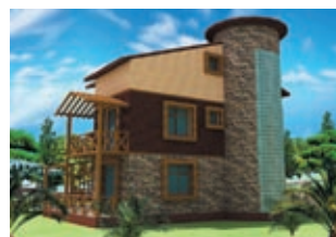
Комплекс Maple Lodge Цена: 156000 €

Комплекс расположен в Белеке, рядом с гольф-клубом Nick Faldo (два 18-луночных профессиональных поля). Расстояние до пляжа Белек — около 3000 м, до аэропорта Анталя — 40 км. Вилла (118 м²) представляет собой 3-этажную гольф-виллу на две семьи. В доме: гостиная с кухней (студия), где уже встроена кухонная мебель и бытовая техника, 3 спальни, одна из которых с ванной комнатой (и с джакузи), 2 ванные комнаты с душевыми кабинами. Установлена вся сантехника, керамические и каменные полы; 2 кондиционера, система водонагрева, 3 балкона, терраса. Инфраструктура комплекса: открытые бассейны (300 м²), детская бассейн, круглосуточная охрана территории комплекса.