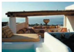
Вилла, Salina Цена: 1000000 €

Monti, Rome. Апартаменты общей площадью 1507 м². Станьте обладателем великолепных апартаментов, расположенных на последнем этаже только что отреставрированного элегантного здания, переносящего вас своей историей в 16 столетие. Впечатляющий вид открывается с террас, окружающих со всех сторон апартаменты. Просторные апартаменты состоят из большой гостиной и столовой с каминами, двух спален, кухни, 2 ванных комнат и 2 кабинетов, которые можно переделать в спальни. Интересные наклонные потолки привнесут изюминку в облик квартиры.