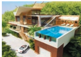
Гольф-вилла класса «Люкс» Цена: 600000 €

Известный гольф-клуб в Белеке (27 лунок, пар 72, 9371 м, общая площадь 130 га), основанный в июне 1997 года и спроектированный английской компанией HAWTREE. При создании гольф-поля ставилась цель — сохранить природный ландшафт в первозданном виде. Это райский уголок между Средиземным морем и рекой, с прекрасным видом на горы Тавры. Климатические условия здесь позволяют играть в гольф круглый год. Рядом с Клуб Хаусом расположены тренировочные площадки: паттинг и чиппинг грин, 2 дополнительных питчинг грин, трехуровневый драйвинг рендж на 40 игроков. А также: бассейн, ресторан интернациональной кухни.