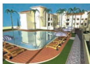
Новый комплекс Sabbia di Marinella Цена: 157950 €

Savoca Villa, Сицилия. Вилла площадью 6458 м². Общая площадь земельного участка — 21528 м². Вилла расположена в городе, где был снят фильм «Крестный отец». Это место, погружающее вас в атмосферу мира и спокойствия, совершенно отличается от образа, созданного в этом фильме. Вилла построена неподалеку от церкви, где венчались Микель и Аполлония. На вилле: просторная кухня и 5 спальных комнат, каждая из которых имеет собственную ванную. Идеальный вариант для открытия отеля 'Bed & Breakfast'. Ощутите настоящую атмосферу тепла и гостеприимства Сицилии.