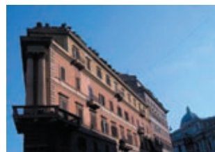
Апартаменты, Monti, Rome Цена: 2500 000 €

Orto Liuzzo, Виллафранка, Палермо. Вилла площадью 3229 м². Общая площадь земельного участка — 344445 м². Бассейн и теннисный корт, великолепный просторный сад, автостоянка на 10 машин. В ясный день из окон вашей будущей виллы открывается сказочный вид на острова Aeolian. О чем еще можно мечтать?!