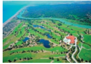
Гольф-клуб в Белеке Цена: 42500000 €

Комплекс «Королевские гольф-виллы» расположен в регионе Белек, около гольф-клуба National Golf Club, в 1 км от моря. Расстояние до аэропорта Анталя — 35 км. 4-комнатные 2-уровневые дуплекс гольф-виллы (205 м²) расположены в круглосуточно охраняемом частном комплексе. Гостиная с кухней (студия), 3 спальни (1 с ванной комнатой, джакузи), 2 ванные комнаты (одна с душевой кабиной), туалет, 4 балкона. Встроенная кухонная мебель и бытовая техника, сантехника, керамические и каменные полы, 2 кондиционера, водонагрев. Инфраструктура комплекса: открытый бассейн — 500 м², детский бассейн — 70 м², детская площадка, спа-центр, фитнес-центр, теннисный корт, магазины.