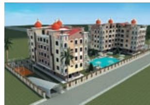
Жилой комплекс ALMARA RESORT Цена: от 55000 €

Расположение: Турция, Бодрум, 15 км до аэропорта, 1500 м от моря. Гольф-вилла класса «Люкс» (300 м²) будет построена по авторскому проекту на территории озера Тузла, где обитают розовые фламинго, рядом с гольф-клубом VitaPARKGolf. Бассейн, автостоянка, участок на 700 м². 1-й этаж: спортзал, сауна, санузел, бильярд; 2-й этаж: гостиная, кухня, санузел, спальня, терраса, балкон; 3-й этаж: 2 спальни и 2 санузла, джакузи, терраса. Встроенная кухонная мебель, сантехника, кондиционеры, водонагрев, бытовая техника, камин. Неподалеку: 2 гольф-поля, гольф-академия, фитнес-центр, рестораны, английский паб и ирландский бар, интернет-кафе, торговый центр с кинотеатром; боулинг и бильярд, бассейны и теннисные корты.