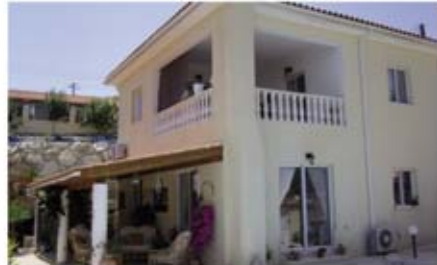
Ref: VPH108. Вилла с 3 спальнями, Полеми, 316 тыс. €