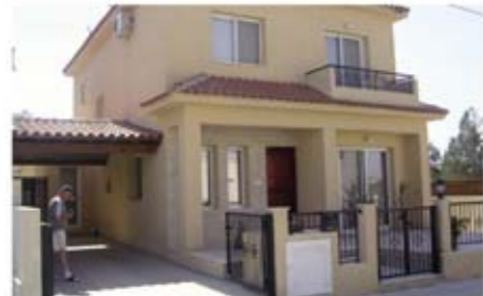
Ref: HLN101. Дом с 3 спальнями, Ларнака, 289 тыс. €