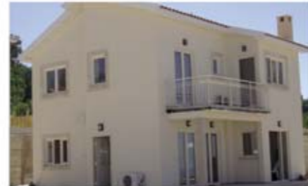
Ref: HPO101. Дом с 3 спальнями, Drouseia, 395 тыс. €