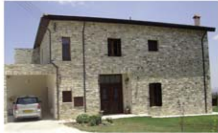
Ref: HLN102. Дом с 4 спальнями, Лефкара, 850 тыс. €