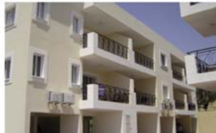
Ref: APO101. Квартира с 2 спальнями, Полис, 134 тыс. €