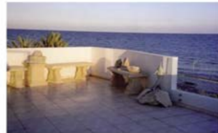
Ref: ALN105. Плательные апартаменты с 2 спальнями, Мелеоу, 579 тыс. €

NewRoad Property cy Limited – независимый международный консультант по недвижимости с офисами в Лондоне и на Кипре. Наш богатый опыт и знание рынка позволяет нам профессионально продвигать недвижимость на потребительский рынок. Вы можете разместить рекламу вашей недвижимости на нашем сайте абсолютно БЕСПЛАТНО! Пожалуйста, обращайтесь за дополнительной информацией.