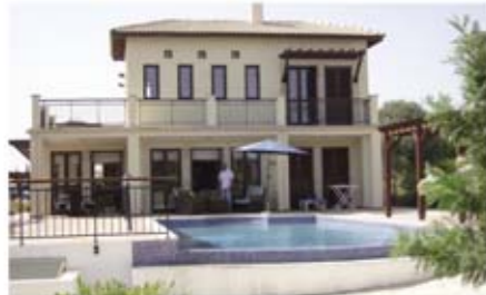
Ref: VPH105. Вилла с 4 спальнями, Aphrodite Hills, 1,1 млн. €