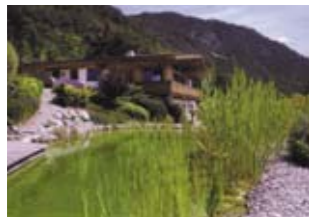
Коттедж в Тироле, Австрия ID: 2650 Цена: 1500000 €

Строящийся комплекс Saranda Bistrica с видом на реку Bistrica и горы в черте города Saranda, у берега моря. Инфраструктура комплекса будет включать бассейн пл. 250 м 2 , кафе и фитнес-центр пл. 300 м 2 . Сдача комплекса: первая очередь — конец 2008, вторая — июнь 2009. Ожидаемая прибыль от сдачи в аренду в летний период года составит 7%. В комплексе 60 апартаментов. Стоимость апартаментов: с 1 спальней (от 72 м 2 ) — от 57250 евро; с 2 спальнями (от 94 м 2 ) — от 76770 евро.