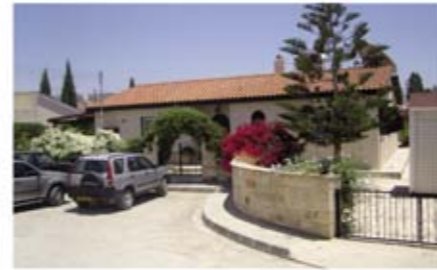
Ref: BPH101. Бунгало с 3 спальнями, Т/thousa, 335 тыс. €