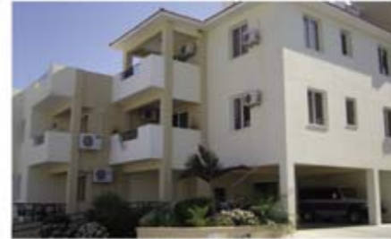
Ref: ALN108. Квартира с 2 спальнями, Ороклини, 137 тыс. €