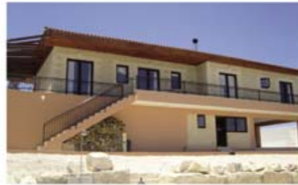
Ref: BPO101. Бунгало с 4 спальнями, Катикас, 640 тыс. €