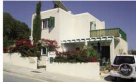
Ref: VPH109. Вилла с 2 спальнями, Тала, 299 тыс. €