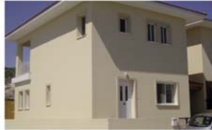
Ref: VLN106. Вилла с 3 спальнями, Ларнака, 255 тыс. €