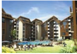
Апартаменты в комплексе Silver Mountain, Разлог, Банско, Болгария ID: 2493 Цена: от 65350 €

Комплекс Silver Mountain Resort: квартиры-студии, двух- и трехкомнатные квартиры, современный 4* отель, бары, рестораны, спортивный зал, крытый бассейн с подогревом, джакузи, сауна, салон красоты, оздоровительный центр, центры проката автомобилей, Интернет-кафе, прачечные, помещения для хранения лыжных принадлежностей, службы безопасности и управления комплексом, услуги микроавтобуса. В окружении гор Рила, Родопы и Пирин, в долине Разлог, в треугольнике, образованном городами Банско, Кулиното и Добриниште. 150 км от Софии, столицы Болгарии.