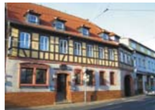
Отель в Дармштадте, Германия ID: 2945 Цена от 1050000 €

Эксклюзивный коттедж в Австрии (321 м 2 ) с видом на долину расположен в тихом уголке Тироля: 15 мин. на машине до аэропорта в Инсбруке, 10 мин. до Зеefeld, 40 мин. до Ишгля или Санкт-Антон в Альберг. Участок пл. 2711 м 2 , сад — 2300 м 2 . Есть пруд для купания, площадка для пляжного волейбола, садовый бар, сауны с террасами, открытый камин, обставленная кухня, террасы вокруг всего дома, частный бассейн. Пл. подвала и подсоб. помещений: 50 м 2 . Пл. двойной гаража — 42,3 м 2 . Отопление: газ, пол с подогревом. Дом построен в 1996 году.