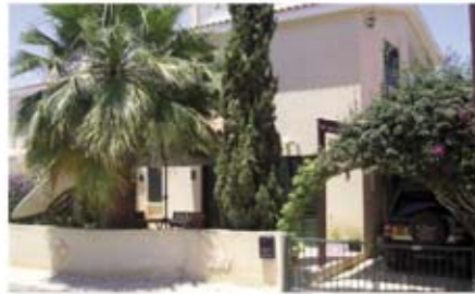
Ref: VPH110. Дом с 2 спальнями, Пейя, 259 тыс. €