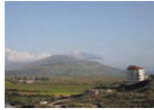
Апартаменты в комплексе Saranda Bistrica, Сандра, Албания, ID: 2794 Цена от 57250 €

Комплекс Silver Mountain Resort: квартиры-студии, двух- и трехкомнатные квартиры, современный 4* отель, бары, рестораны, спортивный зал, крытый бассейн с подогревом, джакузи, сауна, салон красоты, оздоровительный центр, центры проката автомобилей, Интернет-кафе, прачечные, помещения для хранения лыжных принадлежностей, службы безопасности и управления комплексом, услуги микроавтобуса. В окружении гор Рила, Родопы и Пирин, в долине Разлог, в треугольнике, образованном городами Банско, Кулиното и Добриниште. 150 км от Софии, столицы Болгарии.