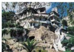
Вилла Savoca Villa в Корлеоне, Сицилия, Италия ID: 2026 Цена: 1000000 €

Выставлен на аукционную продажу 3-х этажный отель на 68 номеров с рестораном. Здание в отличном состоянии. Располагается в немецком городе Дармштадт, в историческом центре. Количество парковочных мест — 16. Год постройки — 1800. Для участия в аукционе необходимы документы, подтверждающие платежеспособность.