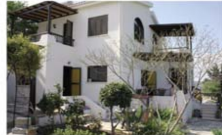
Ref: VPO101. Вилла с 3 спальнями, Кипоуса, 375 тыс. €