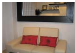
Апартаменты в комплексе Los Patos, Бенальмаден, Коста-дель-Соль, Испания ID: 2598 Цена от 170000 €

Вилла (6458 м 2 ) и участок (21528 м 2 ) расположены в городе, где был снят фильм «Крестный отец». Город Корлеон погружает вас в атмосферу мира и спокойствия. Вилла построена неподалеку от церкви, где венчались главные герои фильма. На вилле расположены 5 спален с собственными ванными комнатами и просторная кухня. Виллу окружает частный сад, собственный бассейн, имеется частная парковка. Восхитительный вид на море. Ощутите настоящую атмосферу тепла и гостеприимства Сицилии!