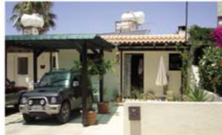
Ref: TRH102. Дом с террасой, 3 спальнями, Хлорака, 199 тыс. €