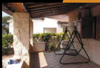
ВИЛЛА Цена: 550 000 евро

Абруццо, Пинето, рядом с Пескарой. Апартаменты в строящемся кондоминиуме. Пинето — городок на Адриатическом побережье в регионе Абруццо, знаменитый своей роскошной сосновой аллеей, которая простирается вдоль моря более чем на 4 километра. Это самый модный из всех курортов области, с современной инфраструктурой и комфортабельными отелями. Недалеко от Пинето расположена известная морская крепость Черрано.