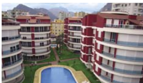
PARADISE PARK RESORT