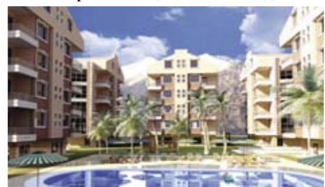
BİLEYDİ ROSE RESIDENCE