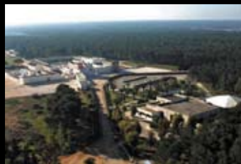
КОМПЛЕКС RESORT HOTEL & RESIDENCES Цена: по запросу

Апулия. Resort Hotel & Residences расположен вблизи главных культурных и туристических центров. Дорога до Ионического моря — 20 мин., до Адриатического моря — 40 мин. Аэропорт Бриндизи — в 40 км (ежедневные рейсы в главные итальянские и европейские города), аэропорт Бари — в 130 км. Комплекс включает: 12 номеров на двоих, 33 оборудованных апартаментов, ресторан, винный бар-паб, конференц-залы, wellness-центр, крытый и открытый бассейн, фитнес-зал, теннисный корт, храм, крытый навес.