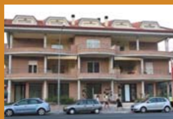
КОНДОМИНИУМ, АПАРТАМЕНТЫ Цена: 240 000 евро

Абруццо, курортный пригород Пескары. Апартаменты в строящемся кондоминиуме. Площадь квартир — от 50 до 150 м 2 . Расстояние до моря — 0 метров. Расстояние до горнолыжного курорта — 55 км. Расстояние до термальных источников — 55 км. Парковочные места.