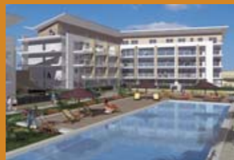
КОНДОМИНИУМ, АПАРТАМЕНТЫ Цена: 2 400-3 500 евро/кв. м 2

Сан-Феличе-Чирчео — это современные отели, дискотеки, бары, в которых выступают итальянские певцы с мировым именем, ночные клубы, туристический порт.