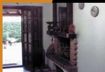
КВАРТИРА В АБРУЦЦО Цена: 530 000 евро

Сан-Феличе-Чирчео — живописный курорт побережья Тирренского моря. Великолепные пляжи, гроты, песчаные дюны, скалы и пещеры. Подножие горы Чирчео.