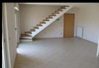
КОНДОМИНИУМ, АПАРТАМЕНТЫ Цена: 190 000 евро

Апулия. Resort Hotel & Residences расположен вблизи главных культурных и туристических центров. Дорога до Ионического моря — 20 мин., до Адриатического моря — 40 мин. Аэропорт Бриндизи — в 40 км (ежедневные рейсы в главные итальянские и европейские города), аэропорт Бари — в 130 км. Комплекс включает: 12 номеров на двоих, 33 оборудованных апартаментов, ресторан, винный бар-паб, конференц-залы, wellness-центр, крытый и открытый бассейн, фитнес-зал, теннисный корт, храм, крытый навес.