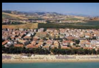
КОНДОМИНИУМ, АПАРТАМЕНТЫ Цена: 2 000 евро/м 2

Абруццо, курортный пригород Пескары. Апартаменты в строящемся кондоминиуме. Площадь квартиры — 96 м 2 . Количество этажей — 2. Комнаты: гостиная с кухней, 2 спальни; 2 санузла. Расстояние до моря — 200 метров. Расстояние до горнолыжного курорта — 55 км. Расстояние до термальных источников — 55 км.