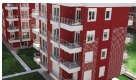
TAURUS PARK RESORT

Недвижимость Анталии BİLEYDİ ROSE RESIDENCE Море и солнце – это навсегда