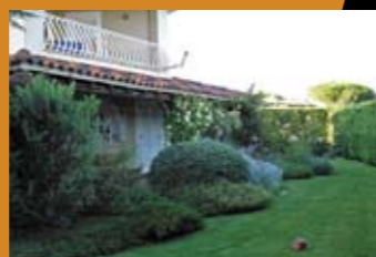
ВИЛЛА Цена: 520 000 евро

Абруццо, курортный пригород Пескары. Апартаменты в строящемся кондоминиуме. Площадь квартиры — 122 м 2 , 2 этажа. Комнаты: гостиная с кухней, 2 спальни; 2 санузла, терраса. Расстояние до моря — 200 метров. Расстояние до горнолыжного курорта — 55 км. Расстояние до термальных источников 55 км.