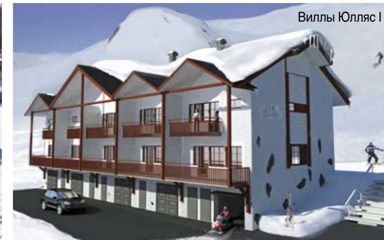
Виллы Юллас I