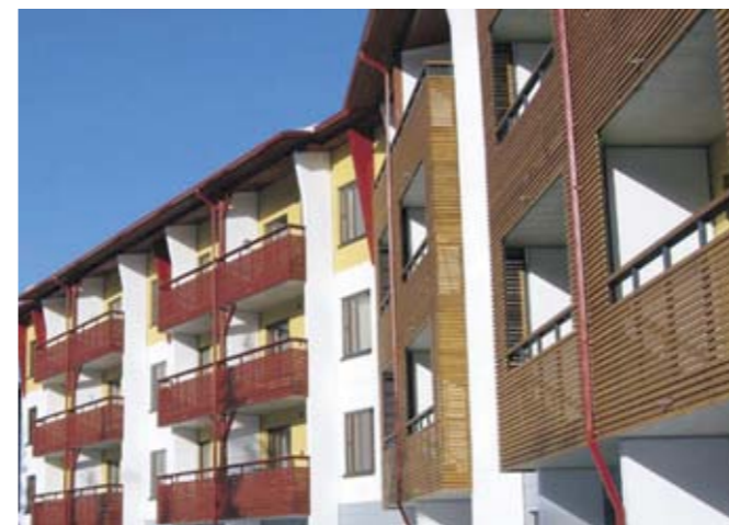
Шале Юллас VII и IX

Можно также воспользоваться гостиничным обслуживанием в собственных апартаментов по уборке, смене постельного белья и предоставлению завтрака. Кроме того, на территории Шале и Вилл располагается и спа-салон.