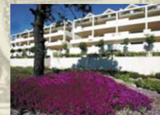
Апартаменты и пентхаусы в г. Эстепона (Коста-дель-Соль) Цена: от 225 000 евро

Апартаменты с видом на парк и горы, расположенные в престижном районе San Juan города Аликанте (Коста-Бланка). Район с хорошей инфраструктурой, рядом школа, супермаркеты, торговые центры, рестораны. До моря — 10 мин. пешком. До аэропорта — 20 мин. на машине. Площадь — 85 м 2 , 3 спальни, терраса (18 м 2 ), пол — ламинат, мебель. Шестизэтажный дом с лифтом. Гараж (бокс) входит в стоимость квартиры. Переоформление ипотеки (95% от стоимости) со старого владельца!!!