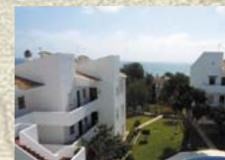
Апартаменты на Коста-дель-Соль Цена: 134 200 евро

Квартира с видом на море, расположенная в городке Mijas Costa (Коста-дель-Соль), на расстоянии 5-6 минут пешком от моря. Комплекс состоит из 38 квартир, у каждого хозяина пульт от входа. На территории комплекса: сад, бассейн. Характеристика: первый этаж, площадь — 90 м 2 , гостиная с камином, 2 спальни, ванная комната, 2 террасы, мебель, кондиционер, собственный садик.