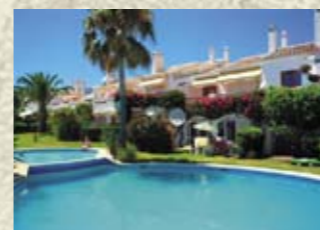
Квартира в городке Mijas Costa (Коста-дель-Соль) Цена: 138 000 евро

Апартаменты и пентхаусы с видом на море, расположенные в закрытом охраняемом комплексе в г. Эстепона (Коста-дель-Соль). Рядом гольф-поле. Апартаменты площадью от 98 м 2 с садом (35 м 2 ), 2 парковочными местами и кладовой — от 230000 евро. Апартаменты площадью от 98 м 2 с террасой (от 57,5 м 2 ), 2 парковочными местами и кладовой — от 225000 евро. Пентхаусы площадью от 103 м 2 с террасой (от 34,5 м 2 ), гостиной с камином, 2 парковочными местами и кладовой — от 245000 евро