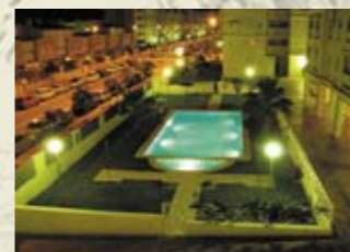
Апартаменты в г. Аликанте (Коста-Бланка) Цена: 313 600 евро

Нестандартный подход нашей компании к потребностям каждого клиента позволяет использовать наши возможности с максимальной выгодой. Звоните и пишите — мы обязательно подберем для вас именно тот комплекс услуг, который вам действительно необходим!