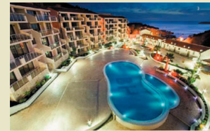
Квартира в Будве, 2 спальни 142 000 евро

Как выбрать и купить недвижимость через Интернет?