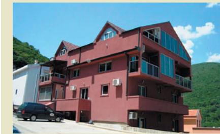
Квартира-студия в Будве 40 000 евро