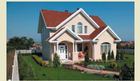
Дом в Бургасе 175 000 евро

Помните популярный советский мультфильм «Простоквашино» и оттуда крылатую фразу «Глядите, до чего техника дошла»? Ирония судьбы в том, что остроумная цитата скоро может стать явью. Техника идет. Еще совсем недавно такой вопрос, как покупка недвижимости за рубежом, казался тяжелым и неосуществимым. Во многом этому способствовала удаленность будущего покупателя от объекта недвижимости, ну и, конечно, отсутствие грамотной информации. Сегодня благодаря Интернету возникла другая проблема: как этой информацией правильно воспользоваться для того, чтобы покупка недвижимости не стала стрессом. Специалисты по продаже зарубежной недвижимости RIPID s. r. o. ( www.realcatalog.ru ) на основе своего 6-летнего опыта работы с клиентами расскажут, как происходит покупка недвижимости через Интернет, как не потеряться в потоке информации и купить дом или квартиру вашей мечты.